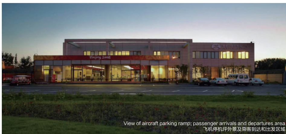
View of aircraft parking ramp; passenger arrivals and departures area 飞机停机坪外景及乘客到达和出发区域

更多关于CJET/Million Air 的详情, 请参见 www.millionair.com/zbaa.aspx , 或发送EMAIL 至 info.zbaa@millionair.com , 致电 +86-10-6455-7365。