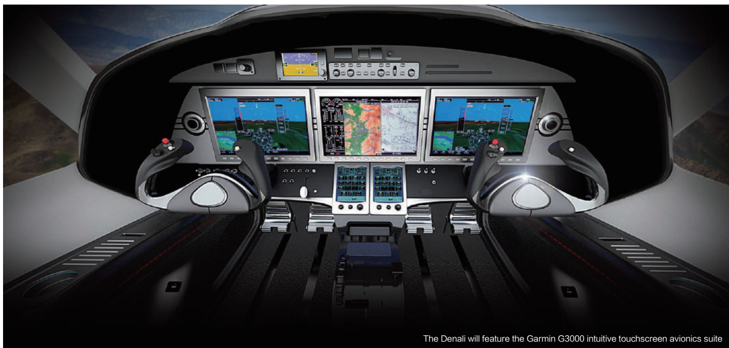
The Denali will feature the Garmin G3000 intuitive touchscreen avionics suite