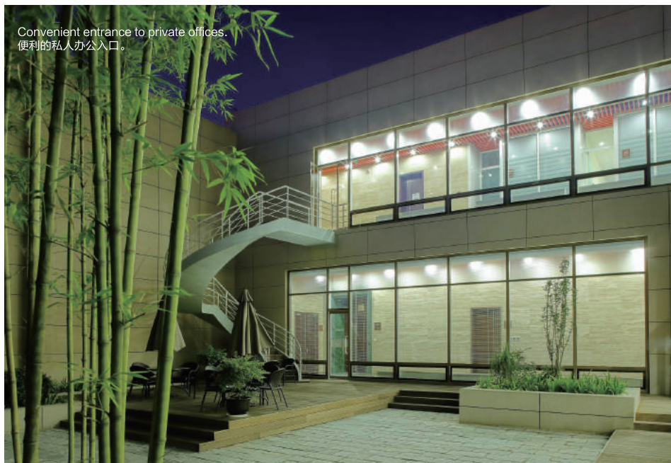
Convenient entrance to private offices. 便利的私人办公入口。

CJET/Million Air 航空公司是由全球高端固定运营基地网络Million Air® 公司、首都公务机公司 (Capital Jet Company, 简称CJET) 和EPIC Aviation 航空公司合作创立, 在不到一年的时间之内, 该公司在北京首都国际机场 (Beijing International Airport, 简称ZBAA) 中稳步发展, 获得了顾客广泛的肯定。但是这些并不出人意料, 因为公司的各位创建伙伴都有丰富的航空经验和能力。Million Air 航空公司的总部设立于美国田纳西州的休斯敦市, 该公司拥有不断成长、覆盖三个大洲的高端固定运营基地 (FBO) 网络, 并且其为公务机/私人机所有人、飞行员和乘客提供的优质服务广受赞誉。在过去四年中, 该公司蝉联成为最佳大型固定运营基地连锁公司 (Best Large FBO Chain)。CJET/Million Air 公司是Million Air 航空公司在中国的首次尝试, 之后Million Air 航空公司还计划在中国其他城市增设固定运营基地。Million Air 航空公司负责CJET/Million Air 北京公司的所有人员培训、海外运营和安全的标准制定、以及客户服务等事宜。